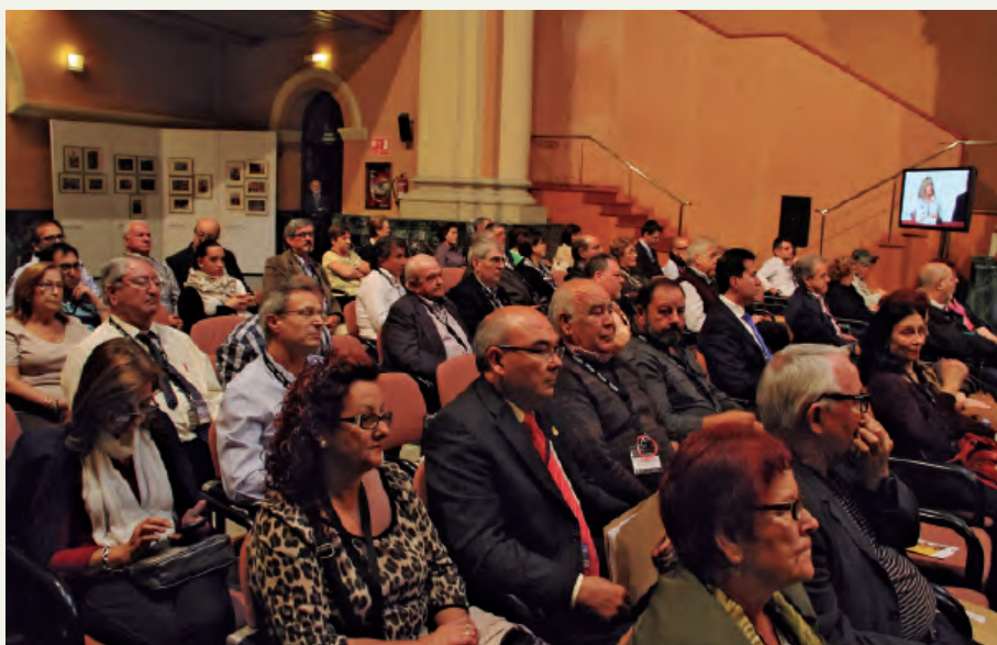
Desarrollo del Congreso.