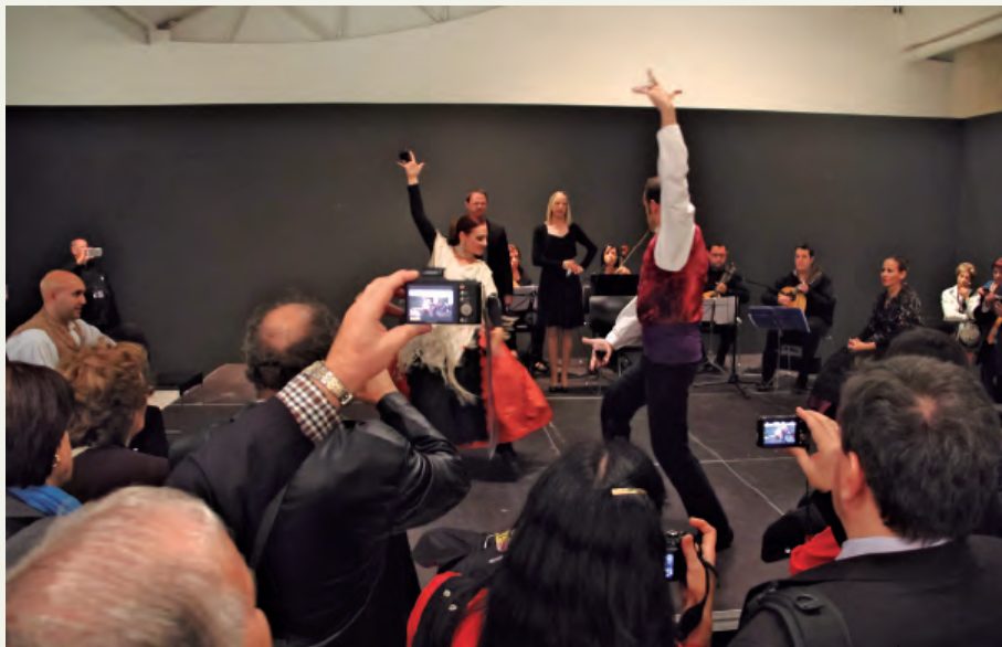
Visita al Museo Pablo Serrano.