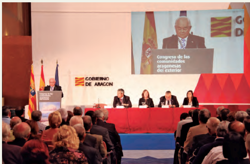
Mesa de la Ponencia.

Está aceptado, que la palabra « jota » significa « baile », y que por extensión se ha llegado a dar tal nombre al bloque o conjunción de