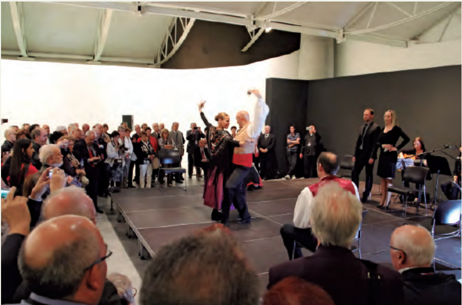
Actuación musical en el Museo Pablo Serrano.