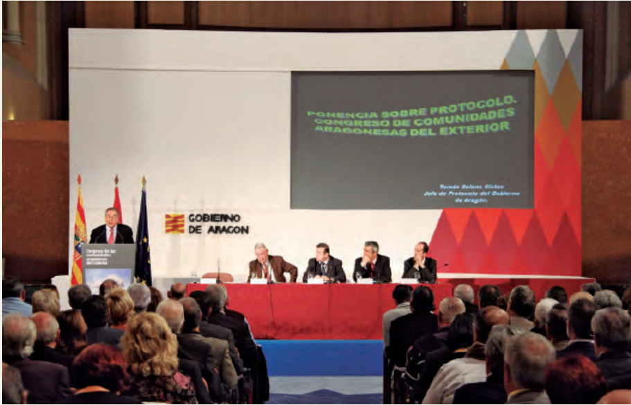
Mesa de la ponencia.